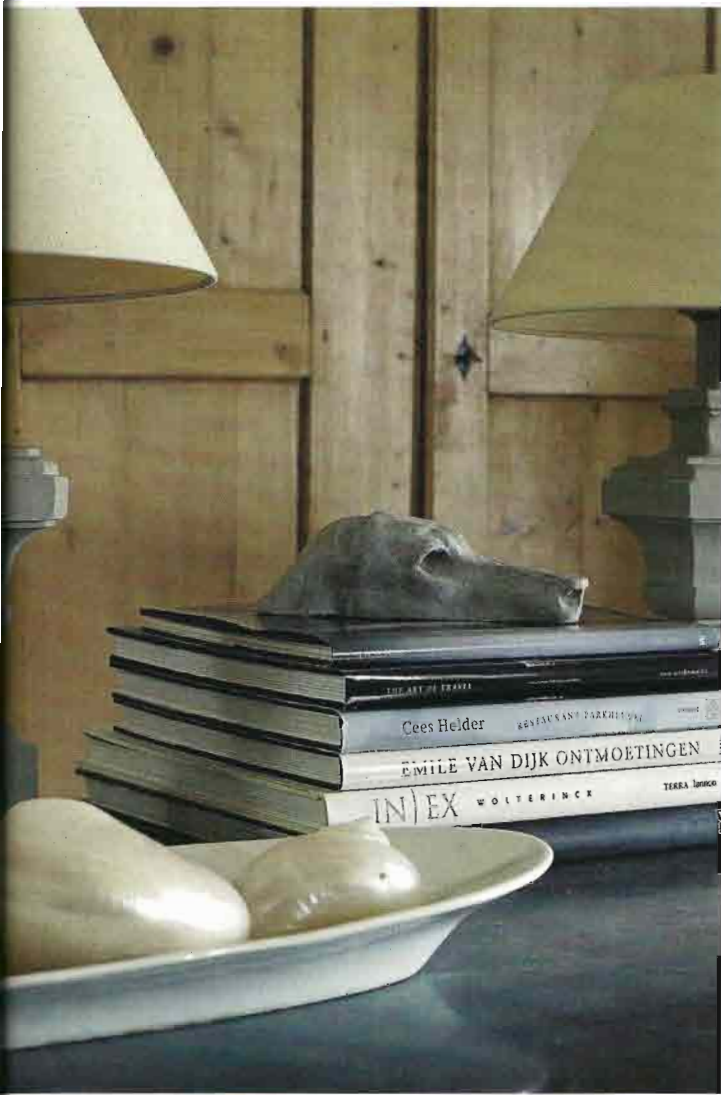
Foto onder: Carl en Yvonne richtten de Bastide de la Savert in met verschillende meubelstukken en accessoires die ze in België en Nederland op de kop konden tikken en met voorwerpen die ze vonden op Provençaalse zolderopruiming. In één van de kamers staat een klein Frans schrijfmeubel dat ze kochten in Nederland en dat dankzij hun verhuizing opnieuw in Frankrijk terecht kwam. Onder het glas van het schrijfmeubel schoof Yvonne enkele brieven die in 1791 in Cannes werden gepost.